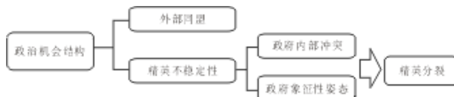
图 1 本研究对政治机会结构的操作化定义

我们发现，在新媒体环境下，媒体成为环境抗争事件中政治机会生成的动力。以民众反核议题为例，